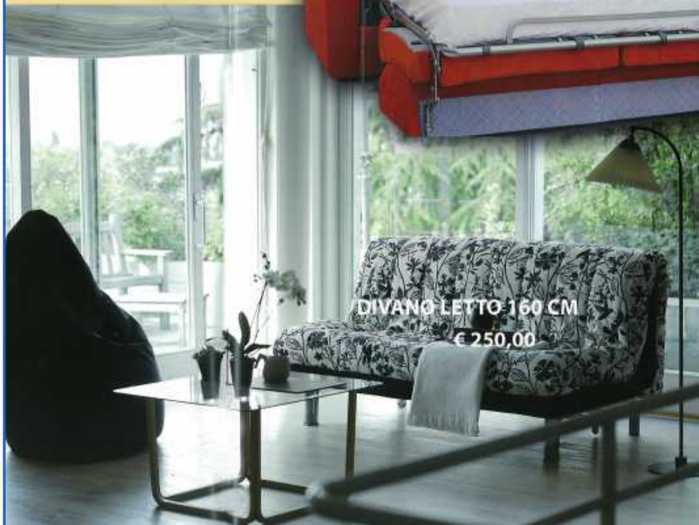
DIVANO LETTO 160 CM € 250,00