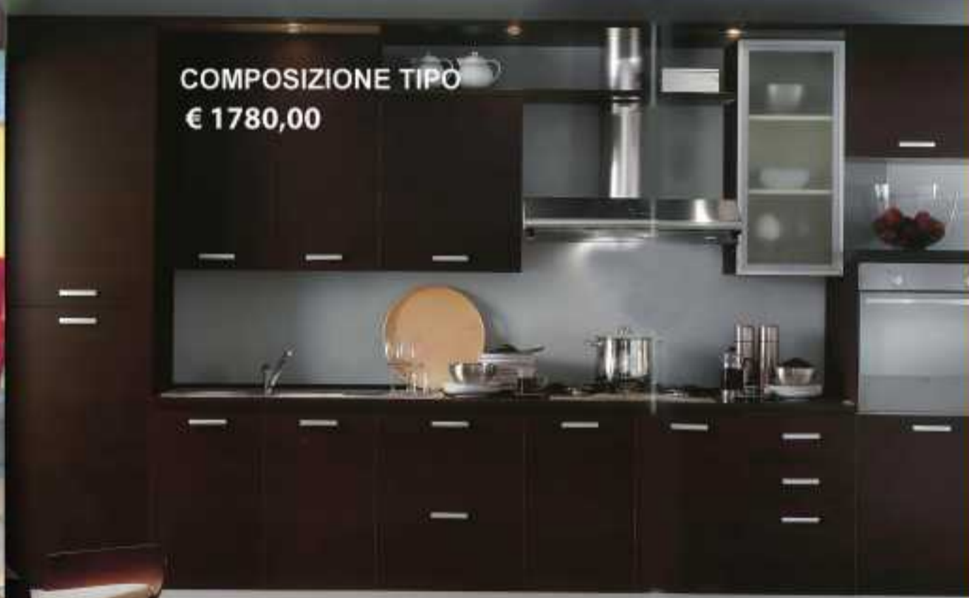
COMPOSIZIONE TIPO € 1780,00