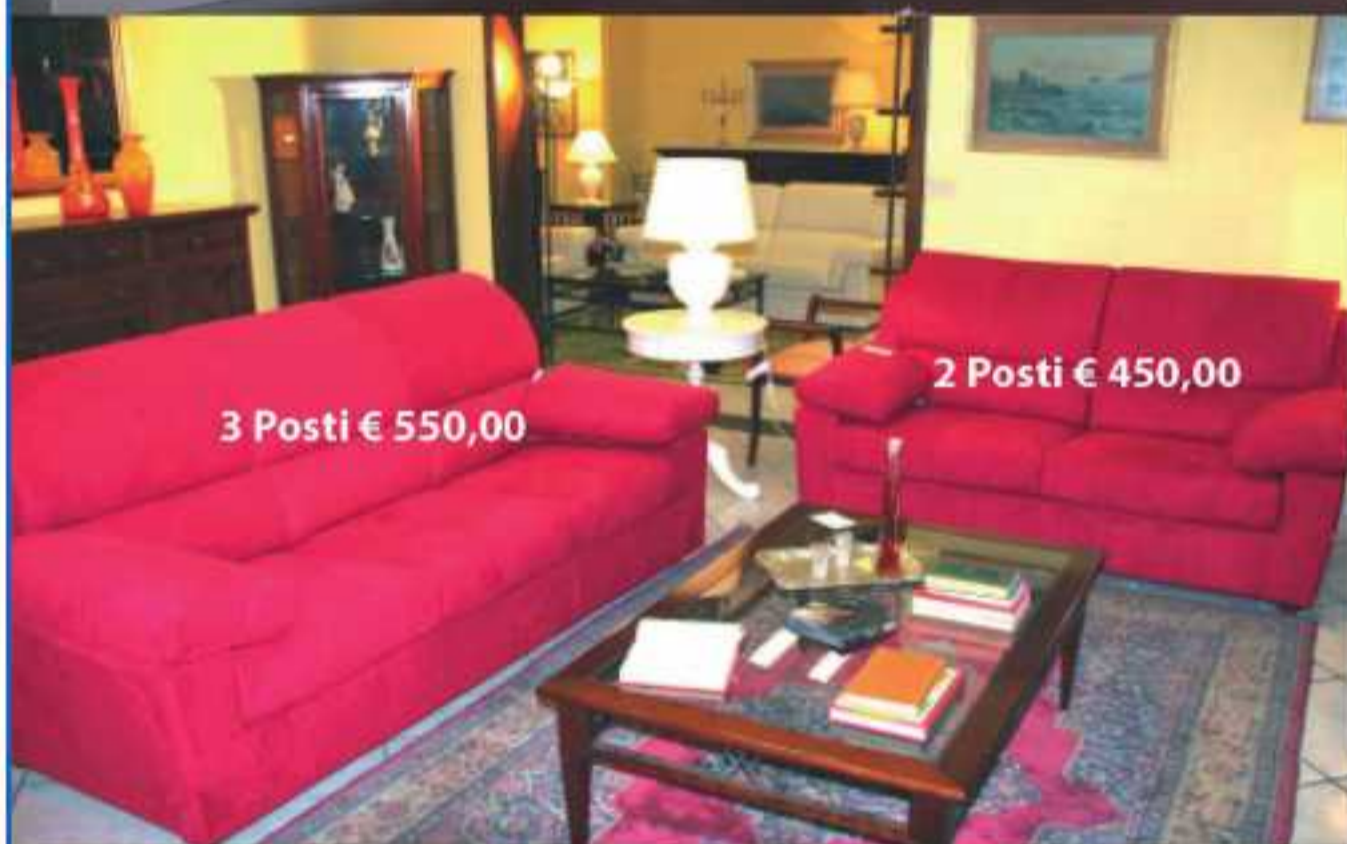
3 Posti € 550,00