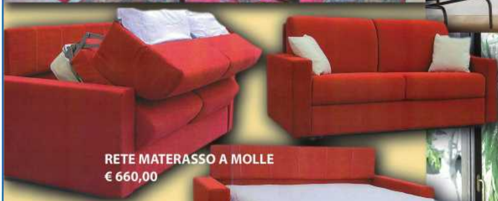
RETE MATERASSO A MOLLE € 660,00