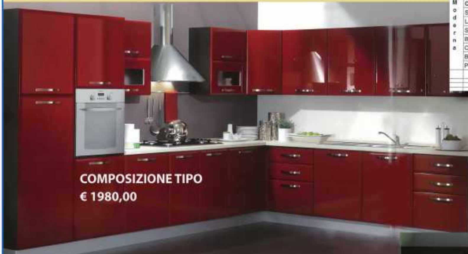
COMPOSIZIONE TIPO € 1980,00