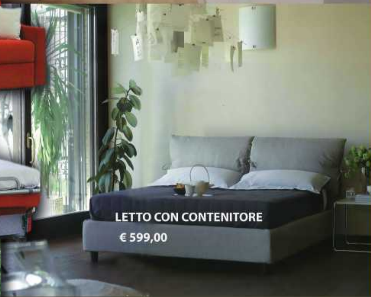
LETTO CON CONTENITORE € 599,00

www.mobilimasella.eu Via Provinciale Piana Bottagna Tel 0187 991010