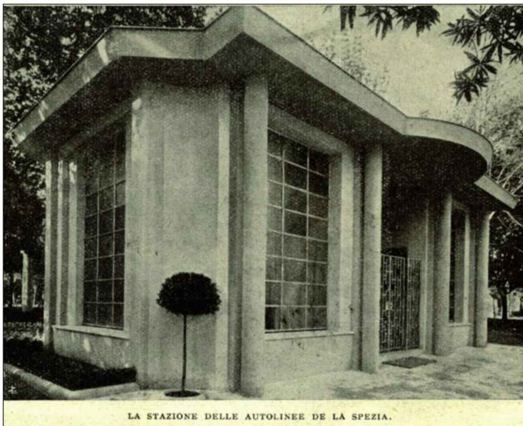
LA STAZIONE DELLE AUTOLINEE DE LA SPEZIA.

Ma in un altro articolo di Danese dell'Opinione dell'8 luglio '33, intitolato "Il cappellino a sghimbescio" e firmato "Moscini", si tira in ballo anche la Stazione delle Autolinee, inaugurata da poco. All'affermazione del Righetti sulla Terra dei Vivi del 25 giugno: "Ho posto tra i più riusciti esempi di nuova architettura la Stazione degli autobus, che stimo migliore del Teatro Civico", Danese risponde: "A