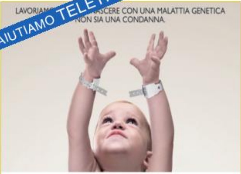
Comune della Spezia, Istituzione dei Servizi Culturali e Telethon coordinamento della Spezia Organizzano